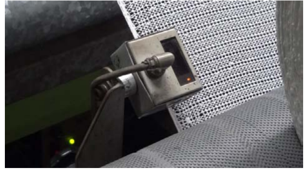
Fotoelektrik Sensör DT-5 beyaz ağ üzerinde kullanılmaktadır.