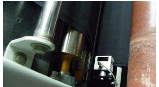
Fotoelektrik Sensör DT-5 siyah kumaş üzerinde kullanılmaktadır.